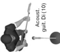
Acoust. guit. Di (10)