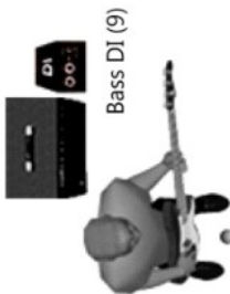
Bass DI (9)