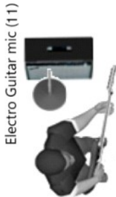
Electro Guitar mic (11)